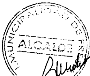
RODRIGO GUARDA BARRIENTOS ALCALDE